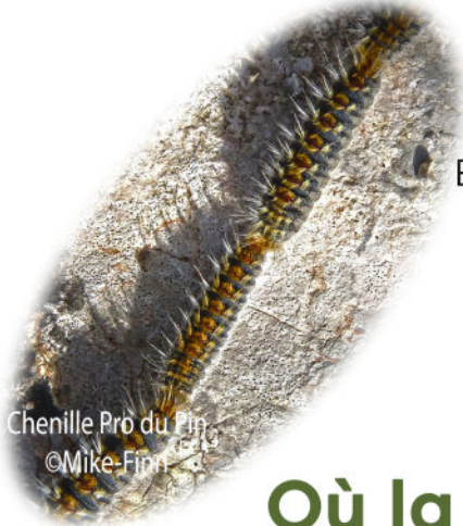
Chenille Pro du Pin